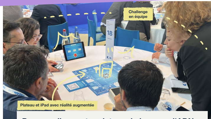
Plateau et iPad avec réalité augmentée

Personnalisez votre plateau de jeu avec l'ADN de votre entreprise !